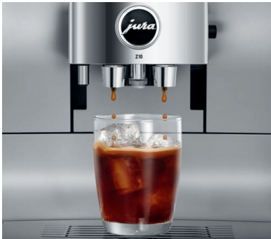
Detailausschnitt der Z10 Aluminium White